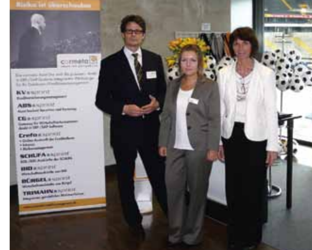
Das Cormeta-Team - auf dem BvCM Bundeskongress 2011 in der Commerzbank-Arena - bietet Credit Management Tools für Konzerne und mittelständische Unternehmen.

So hat sich letzten Endes ausgezahlt, dass man sich für die Neustrukturierung des Kreditmanagements Zeit gelassen hat – auch wenn das eigentliche Projekt nicht mehr als zwölf Monate gedauert hat. Das Ziel hat Miele erreicht: durch die Optimierung von bestehenden Methoden, Verfahren und Instrumenten für Kreditvergabe und -überwachung die gegenwärtigen und künftigen Risiken im Kundenportfolio besser zu identifizieren und aktiv zu steuern. Grote möchte zwar keine konkreten Zahlen nennen, aber die Gefahr von Forderungsausfällen ist seitdem gesunken. Von seinen Erfahrungen berichtet er regelmäßig auf dem Roundtable Credit Management, einer von Cormeta initiierten branchenübergreifenden Veranstaltungsreihe. Hier diskutieren Kreditmanager namhafter Unternehmen – neben Miele unter anderem Bitburger, Bischof & Klein, Böhler-Uddeholm, Bridgestone, Klöckner, Koehler Paper