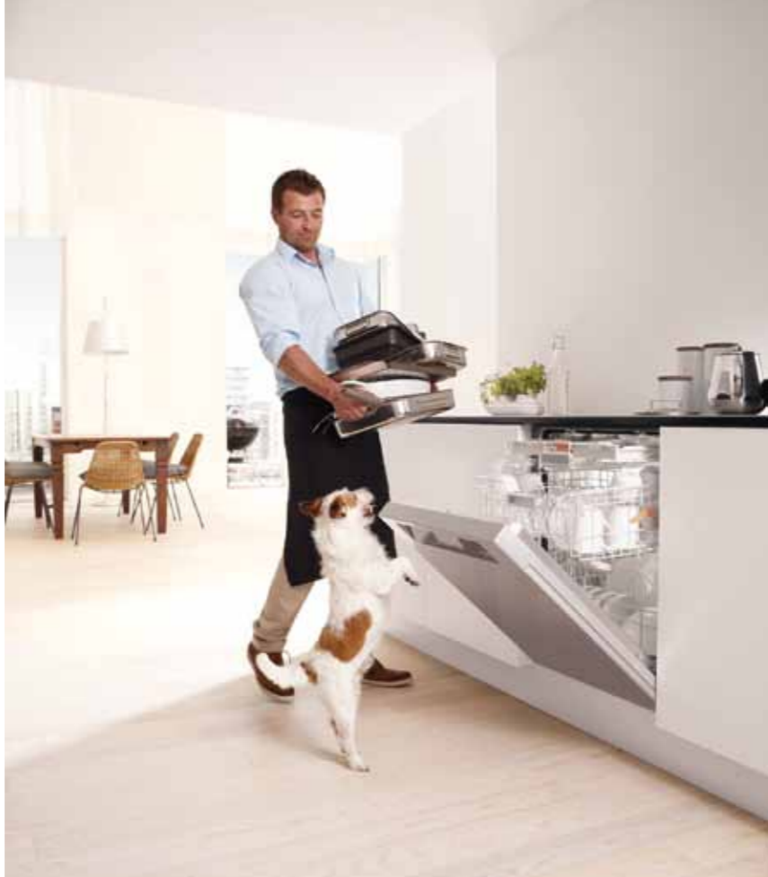
Der Haushaltsgerätehersteller Miele ist bekannt für seine hochwertigen Produktlösungen. Das Familienunternehmen vertraut in Sachen Debitorenmanagement auf eine spezielle Software.

Mit „Crefosprint“ besitzt Miele ein Frühwarnsystem, das schleichende Veränderungen im Zahlungsverhalten rechtzeitig erkennt. Das System registriert jede Veränderung (neue Faktura, Mahnung, Zahlungseingang, geänderte Wirtschaftsauskunft) auf einem Kundenkonto. Ändern sich dadurch die Risikoklasse und damit der Kreditrahmen, schlägt die Software entsprechende Maßnahmen vor – beispielsweise Limiterhöhung/-reduzierung oder Anfordern von zusätzlichen Sicherheiten. Der Kreditsachbearbeiter bekommt den Vorgang in seinem Arbeitsvorrat angezeigt. Grundsätzlich werden alle Kunden in sechs Risikoklassen eingestuft, feste Limits gibt es nicht. Vielmehr richtet sich die Höhe nach dem zu erwartenden Umsatz, der Summe der Außenstände, der Kontobewegung und der Höhe der dazugehörigen WKV. Auch Negativmerkmale wie Rücklastschriften und WKV-Kündigungen beeinflussen den Kreditrahmen. Ebenso der Fakt, ob jemand mit Skonto bezahlt oder nicht. Neukunden bekommen zunächst ein Standard-